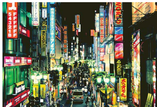
Shinjuku by night