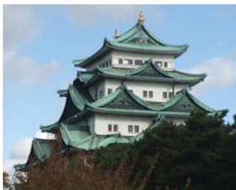
Château de Nagoya