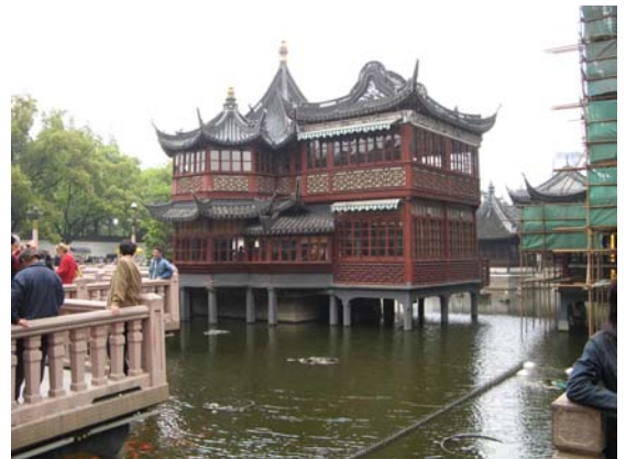
Shanghai - vieille ville

Visite du Jardin Yu et la vieille ville, puis visite de Pudong et ses gratte-ciels (World Financial Center 492 m) Déjeuner et Dîner en ville Nuit dans votre hôtel de charme***