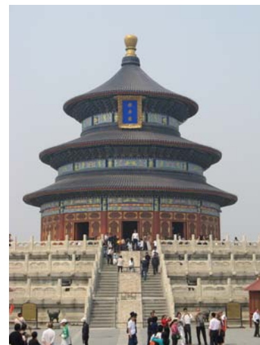
Temple du Ciel

Transfert vers l'aéroport de Shanghai, Vol pour Pékin. Accueil aéroport puis transfert et installation à l'hôtel. Découverte de la place Tian'anmen, de Wangfujing. Dîner en ville Nuit dans votre hôtel de charme***