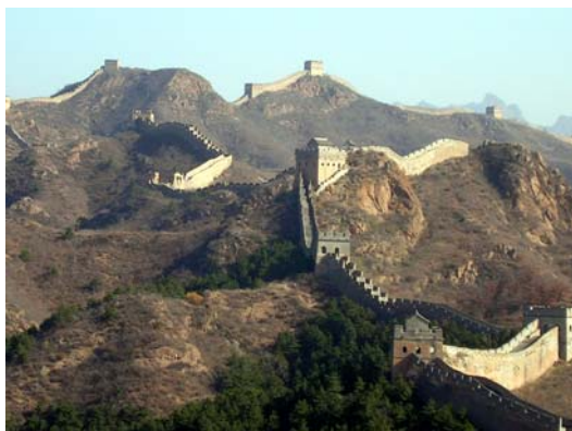
La Muraille de Chine

Visite du marché de Panjiayuan, du Temple du Ciel, du quartier de la Tour du Tambour et de la Tour de la Cloche. Découverte des Hutongs et soirée au bord du Lac Houhai Déjeuner et Dîner en ville Nuit dans votre hôtel de charme***