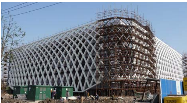
Le Pavillon France en décembre 2009

Journée libre Expo Universelle Les 20 et surtout 21 juin ont été «déclarées journées de la France» au niveau de l'organisation de l'Exposition Universelle Shanghai 2010 Nuit dans votre hôtel de charme***