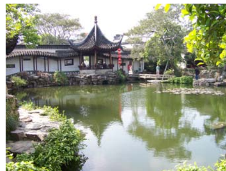
Jardin du Maître des Filets

Transfert vers Suzhou. Visite du village de Luzhi, visite libre de Suzhou Déjeuner et Dîner en ville, Nuit dans votre hôtel de charme