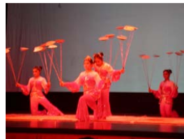
Cirque de Shanghai

Visite du Musée de Shanghai, place du peuple, puis journée libre, shopping. Le soir, spectacle de cirque. Déjeuner et Dîner en ville Nuit dans votre hôtel de charme***