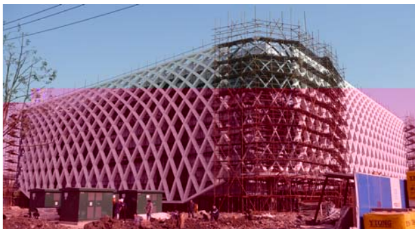
Le Pavillon France en décembre 2009

Journée libre Expo Universelle Nuit dans votre hôtel de charme***